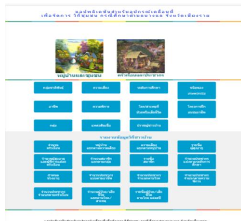
ภาพประกอบที่ 2 หน้าจอหลักแอปพลิเคชันสำหรับอุปกรณ์เคลื่อนที่ เพื่อจัดการวิถีชุมชน กรณีศึกษาตำบลนางแล จังหวัดเชียงราย

3) การพัฒนาแอปพลิเคชัน ในส่วนขั้นตอนนี้ จะสร้างแอปพลิเคชันสำหรับอุปกรณ์เคลื่อนที่ เพื่อจัดการวิถีชุมชน กรณีศึกษาตำบลนางแล จังหวัดเชียงราย โดยใช้ภาษา PHP ในการเขียนโปรแกรม และใช้ MySQL สำหรับจัดเก็บข้อมูล ผลการพัฒนาประกอบด้วย ส่วนการจัดการข้อมูล และส่วนการแสดงผล รายงาน แสดงตัวอย่างหน้าจอตั้งภาพประกอบที่ 2 ถึง 4